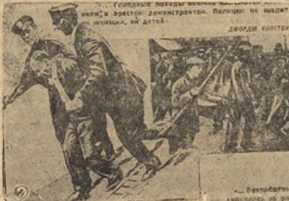
Фотоколлаж из журнала межрабсвязи.