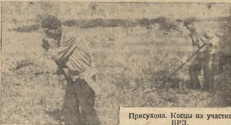
Присухона. Косцы на участке ВРЗ.