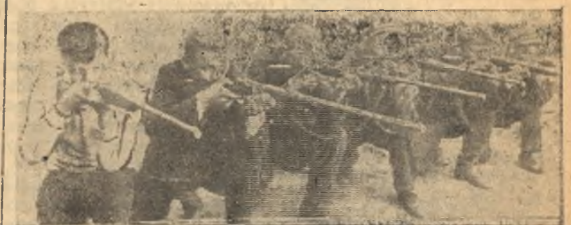
Освавиахимовцы за стрелковой подготовкой.